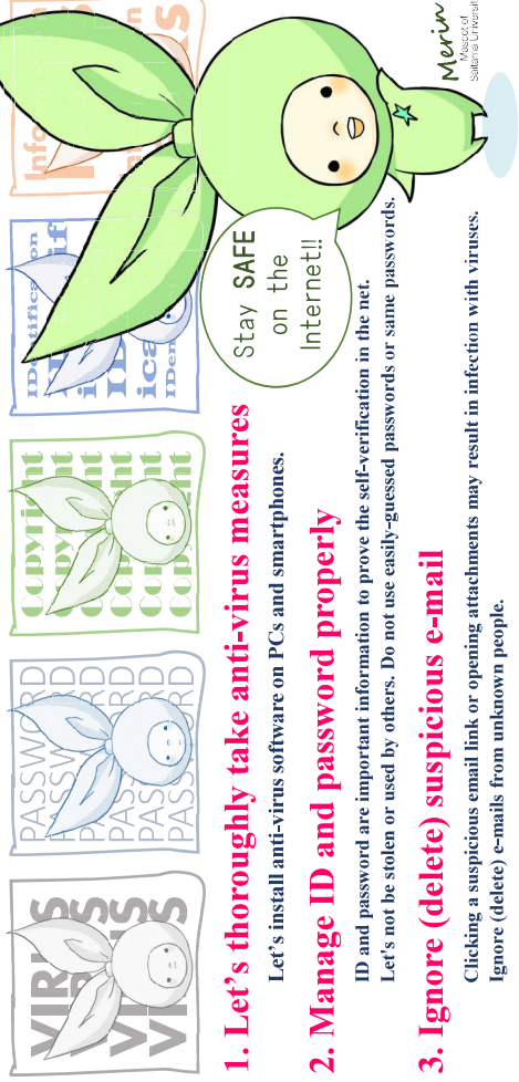
Merin Masokotto Cyber Center Saitama University

time. Always take measures against information security and have a safe, secure internet life.