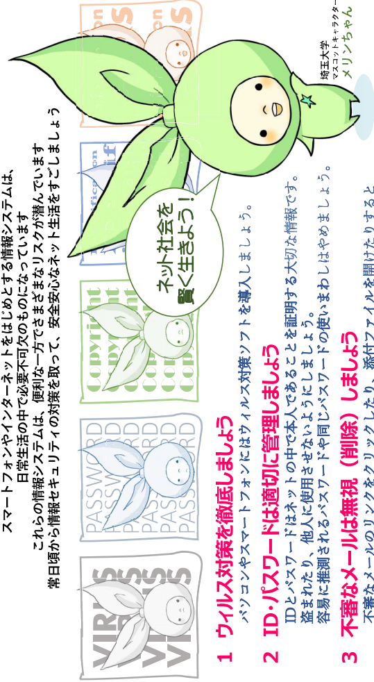
埼玉大学 マスコットキャラクター メリンちゃん